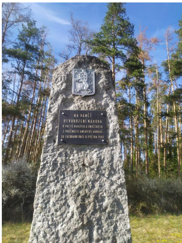
Pomník osvobození v Poli (americká armáda)

S blížícím se koncem války sílily proudy ustupujících německých vojáků. Americká armáda překročila západní hranici, z východu přicházela Rudá armáda. Někteří Němci však stále doufali ve vítězství a nechtěli se vzdát... 5. května vypuklo v Praze povstání. To byl impuls k tomu, aby se celá země vzedmula ke konečnému vítězství. A pak už nastal den D - den, kdy vstoupili na Blatensko naši osvoboditelé. Stalo se tak 6. května 1945.