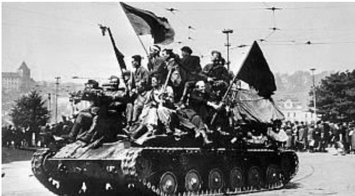
text a foto Alena Honzová

Jeden mladý Američan v okolí Čechelovic padl, byl odvezen a pochován ve své rodné zemi.