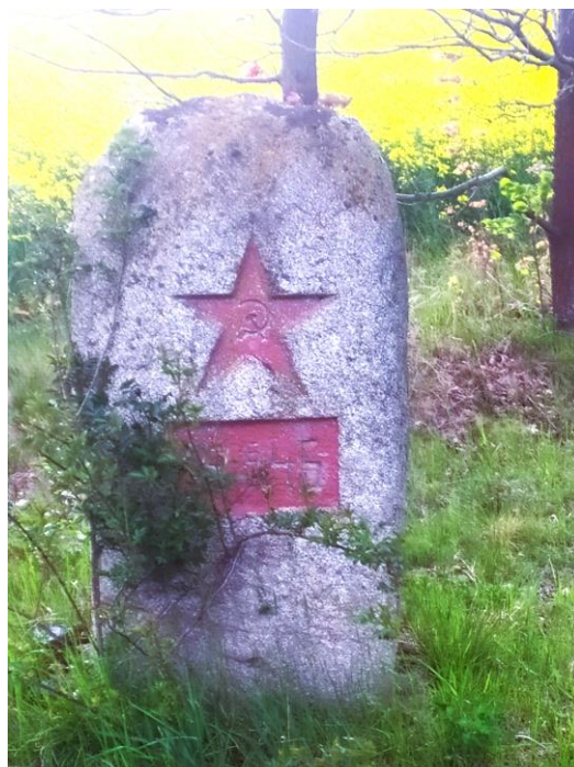
text a foto Alena Honzová